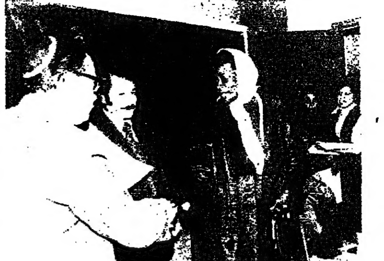
وعدا السيد برغمان الذي كان يتحدث في حفل تخريج ٨٥ سيدة وفتاة أهيت في مركز المولوية في المدينة القديمة ، دعا الى مواصلة الجهود لاجل هذه النشاطات التي تعود على المجتمع العربي في المدينة بالخير والرفاهة ، وقال ان الشبيبة العربي واليهودي لا يمانان في حسن جوار نخب بل وتوافق على ما يخدم المصالح التي تعود على جميع مواطني المدينة.

القدس - لنائب رئيس البلدية الخاص - التي السيد داويد برغمان نائب رئيس البلدية كلمة أعرب فيها عن تقديره للجهود التي تبذل من أجل خدمة المواطنين العرب في مجال النشاطات التربوية والثقافية وغيرها .